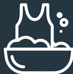
Zona de ropas